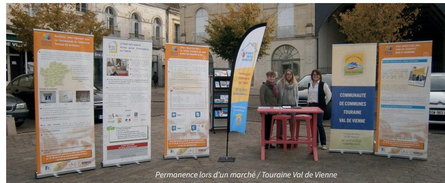
Permanence lors d'un marché / Touraine Val de Vienne

7 OPAH ou PIG 2 Opérations Façades 1 Etude pré-opérationnelle 2 logements communaux (1) 10 équipements publics 272 communes concernées (1) Maîtrise d'œuvre ou Assistance à Maîtrise d'Ouvrage ou Maîtrise d'Insertion