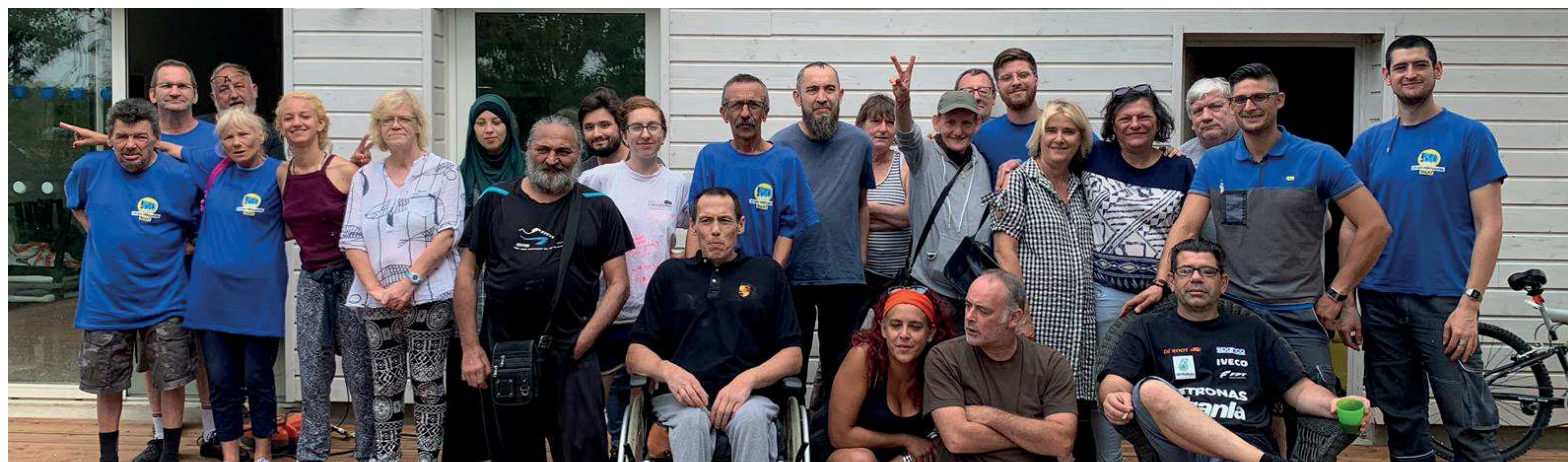
Chantier solidaire à la pension de famille du Phare, Fondettes

1 entrée 2 sorties 523 repas partagés 28 visites organisées