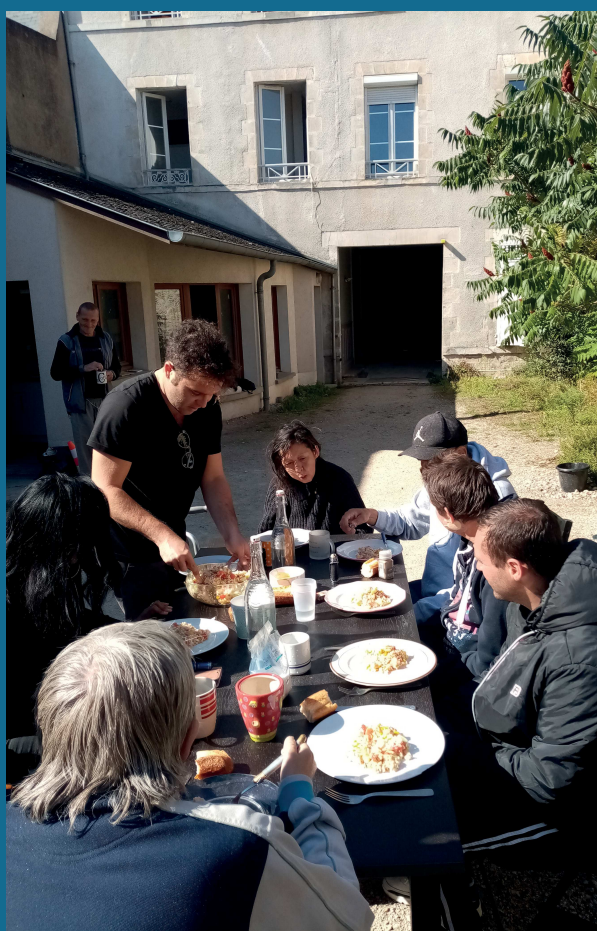
Repas partagé dans la cour de l'immeuble

« Ensemble on va plus loin » dit l'adage. C'est bien ce que nous croyons depuis que cette belle aventure de la Pension de famille et bientôt de l'habitat inclusif a commencé à Orléans (grâce au concours des Résidences de l'Orléanais) ! L'année 2023 sera un autre chapitre à plusieurs que nous avons hâte de faire partager à tous ceux qui nous ont accompagnés dans ce projet innovant. C'est d'ailleurs bien en ces termes que le prix de l'innovation d'Orléans Métropole l'a récompensé en juin 2022.