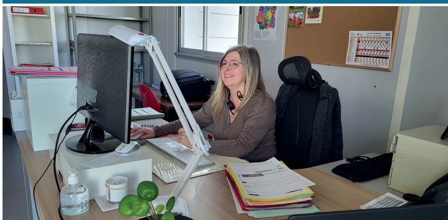
Nouveaux locaux SOLIHA à Déols

552 rue Georges Clémenceau 36130 DÉOLS 02 54 07 01 08 contact.indre@solihia.fr