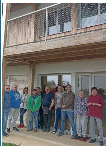
« Déplacés ukrainiens »